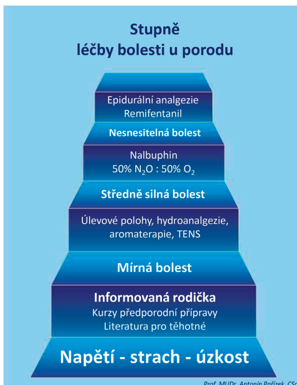
Obr. 1 Volba analgezie u porodu